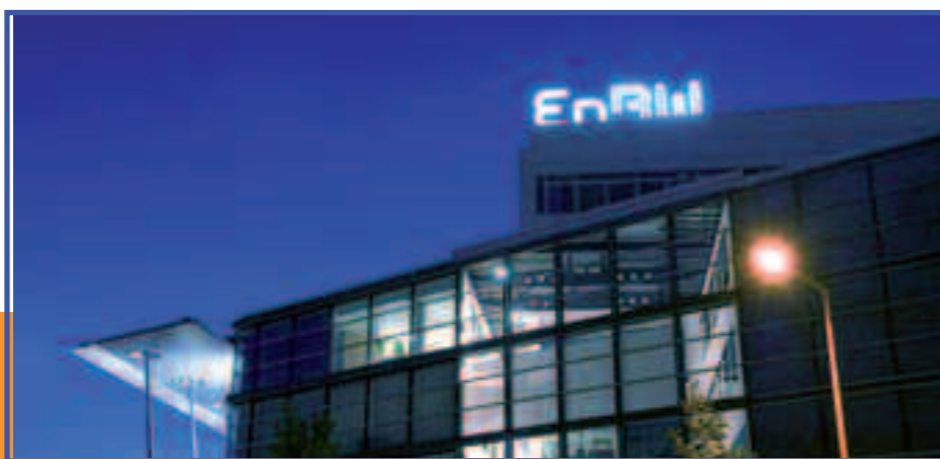
Die EnBW-Zentrale in Karlsruhe