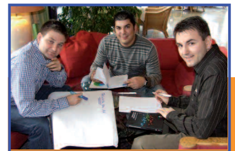
In kleinen Gruppen reflektieren die Teilnehmer erworbenes Wissen.

„Unsere Teilnehmer fühlen sich durch das Training sicherer und merken nachhaltig den Erfolg. Die erlangten Kenntnisse und Fähigkeiten bedeuten weniger Stress, das wirkt deeskalierend und sorgt präventiv für mehr Sicherheit“, fasst Springer zusammen. Eine Fortsetzung der erfolgreichen Kooperation in 2007 wird derzeit vorbereitet